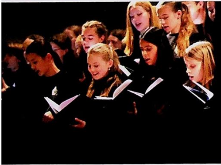
► Die Chorschule St. Margareta · S. 168